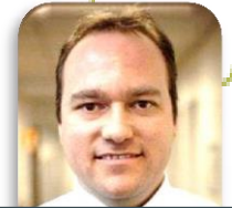
Romuald POIRAT CLEMESSY SERVICES