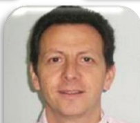
Gilles BENVENISTE LAFARGE CEMENTS