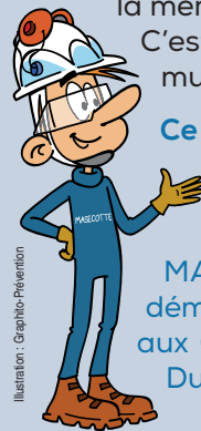
Illustration : Graphico-Prévention

C'est un plus dans les relations multi-entreprises.